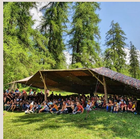
Kantonales PfiLa in Churwalden 2022