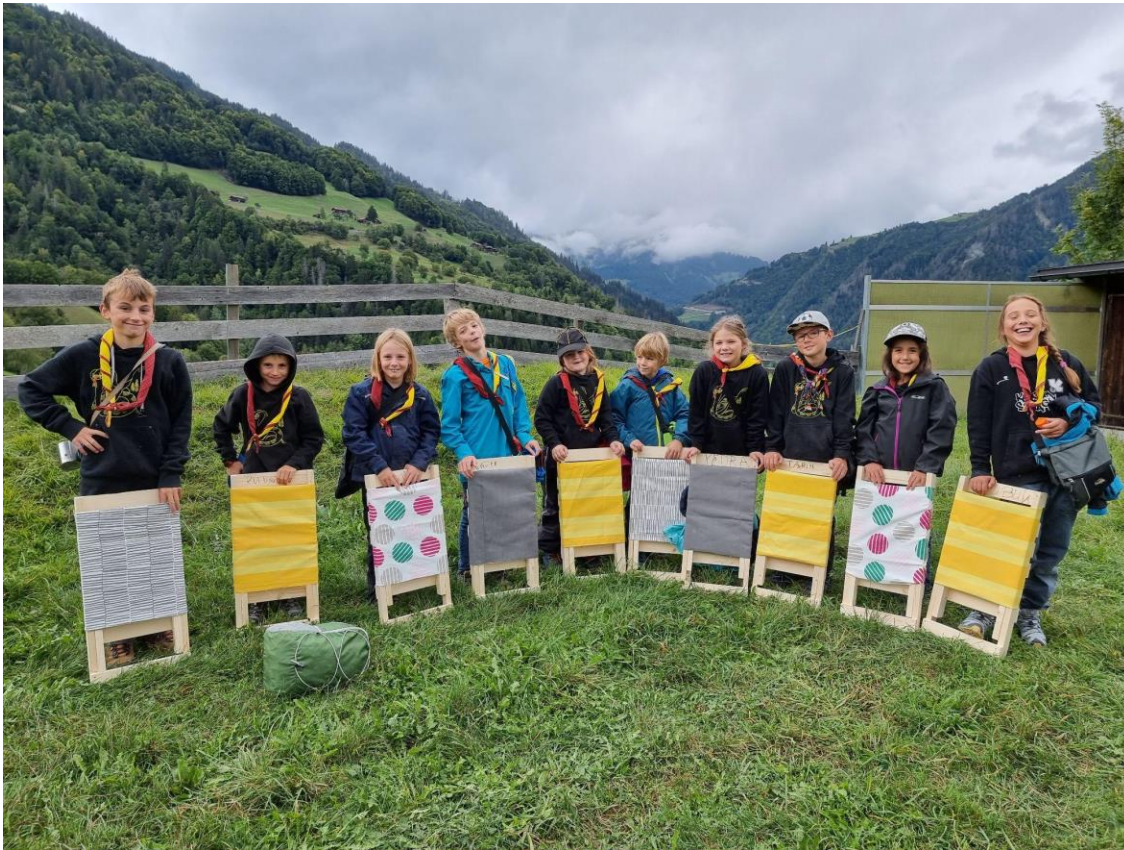
Selbstgebaute Pfadistühle für kommende Weekends und Lager